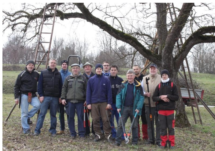
Helfer des OGVs beim Einsatz auf ihrem Pflegegrundstück