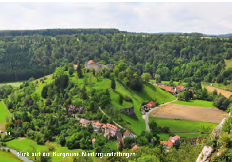
Blick auf die Burgruine Niedergundelfingen

Das Tal entlang der Lauter zählt zudem zu den burgenreichsten Tälern Südwestdeutschlands. Besonders hervorzuheben sind die Burgruine Bichishausen, die Burgruine Hohengundelfingen, die Burgruine Niedergundelfingen, die Burg Derneck, die Burgruine Wartstein sowie die Burgruine Hohenhundersingen.