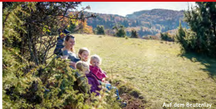
Auf dem Beutenlay